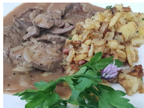
Kalbsleber Sauer mit Bratkartoffeln